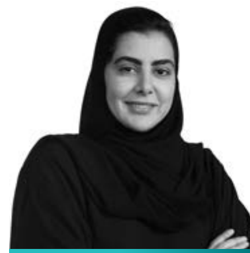
سما بنت فيصل آل سعود