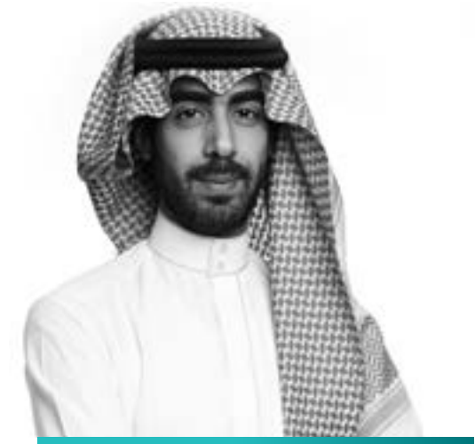
سلمان بن فيصل آل سعود